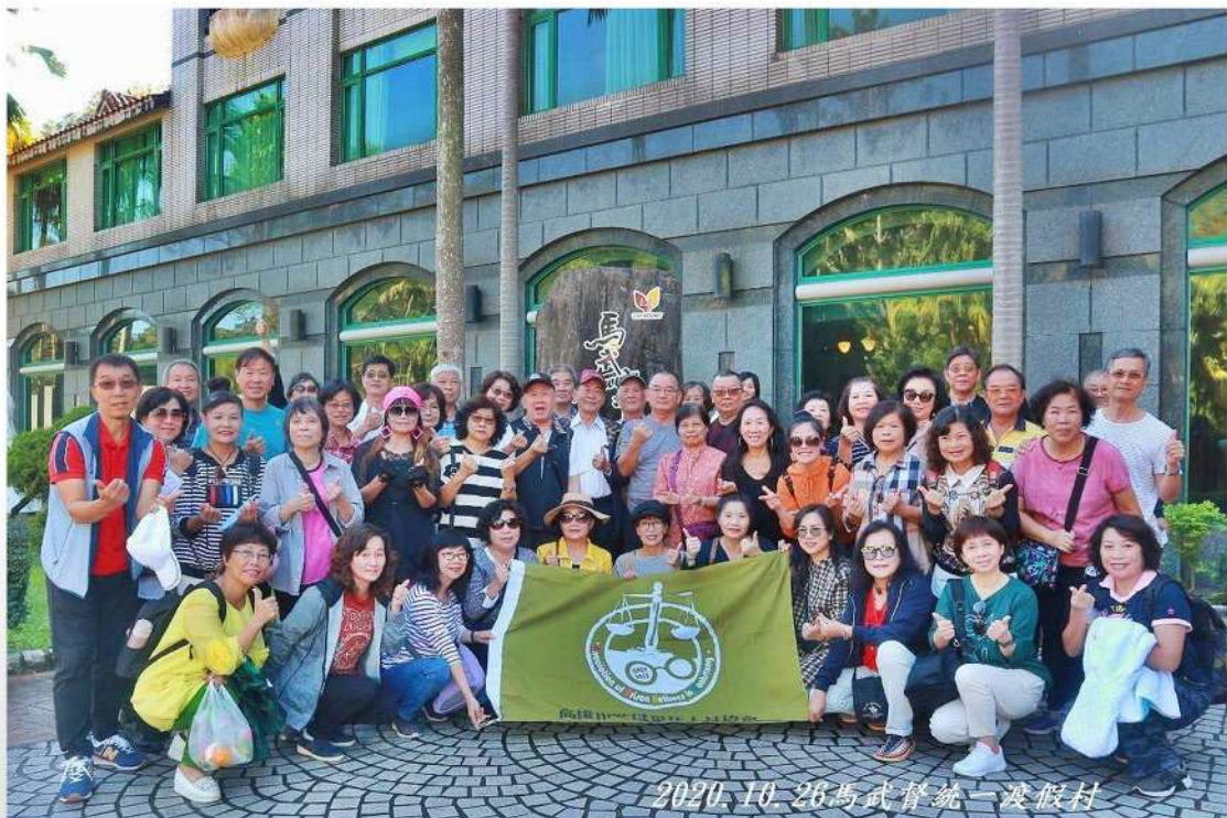
高雄市監獄退休協會在馬武督渡假中心合照

最後，更要感謝所有參與此次旅遊的會員眷屬們，於秋高氣爽的季节，讓我們一起共同渡過三天兩夜的秋季旅遊，增加了彼此的友誼，留下了旅途許多溫馨的回憶！謝謝大家，期待再相會！