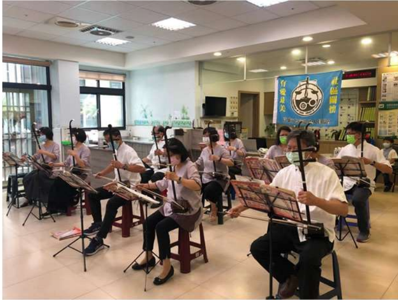
協會國樂及舞蹈社團員愛心活動