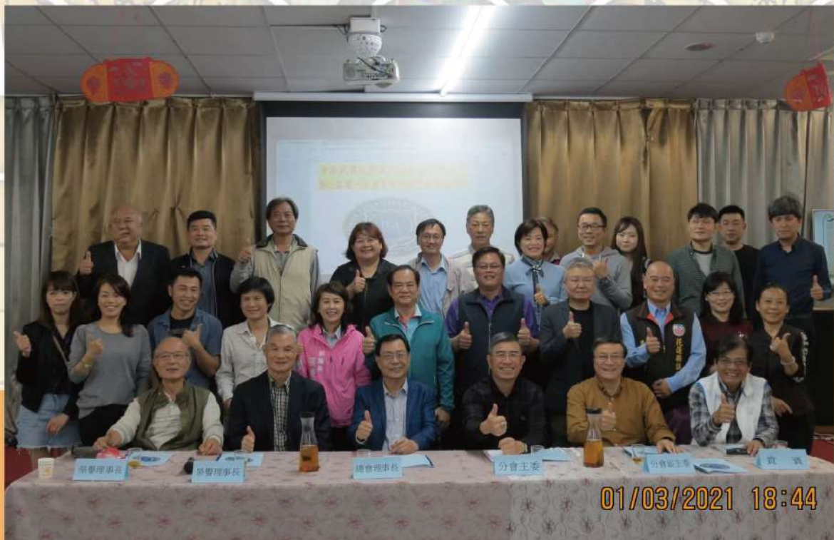
本會鄭理事長一行與宜花東分會吳主任委員及顧問、委員合影留念