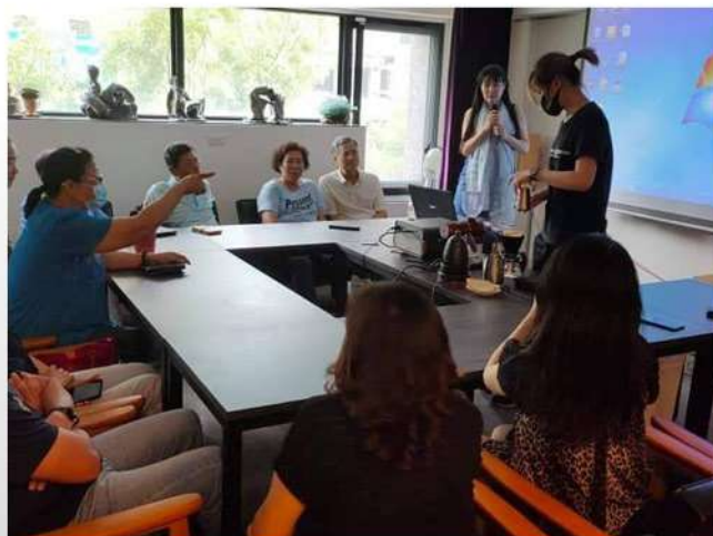
會員眷屬上課後合影留念

咖啡的地位是絕對的 人們成為社群 舒適的環境是必然的 人們自在談話 方便的往來是應該的 人們產生交集 文化的空氣是滿滿的 人們相互連結