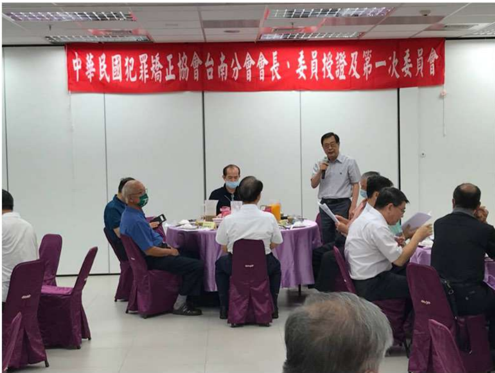
鄭理事長榮豪致詞；勉懷過去，策勵將來，亦對台南分會讚譽有嘉。

是的，很多人認為你經營企業只是為了賺錢，你就算是累死也是天經地義的；有多少人知道，如果只是為了賺錢，有多少已經完成原始資本積累的老闆，完全可以選擇把企業賣掉，因為賺的錢一輩子都花不完；只有你自己了解心中的追求，只有你自己明白，作為『船長』的責任；只有你自己知道，這就是上天賦予你的使命！你告訴自己：既然選擇了做船長，就要為船上所有的人負責！