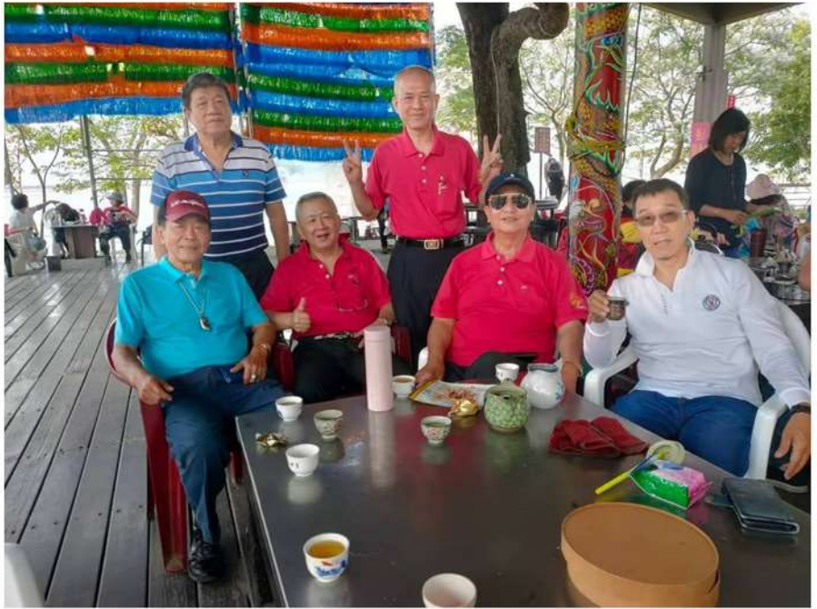
前後任理事長涼亭下休憩泡茶

寬敞的泡茶區，適合泡茶的環境外，也很適合運動健康操。會員眷屬泡茶後，一時興起，播放著恰恰舞蹈音樂，跳起了活動筋骨的社交舞來，大聲地嗨了起來！一首又一首的恰恰舞曲跳下來，流了滿身大汗，歡樂的笑聲健康又開心。泡茶區旁環湖步道，正值苦楝花開季節，如細雪般的粉紫色花瓣，隨著微風飄散陣陣的清香，泡茶區品茶聊天同時，望著湖光