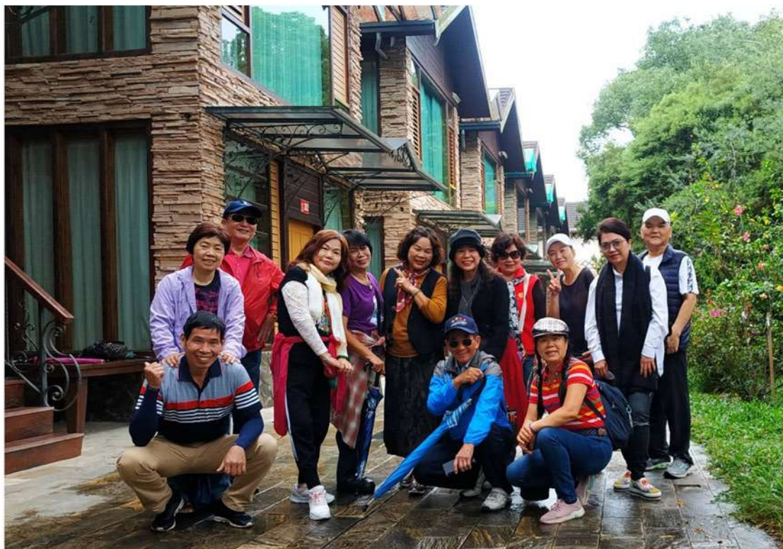
吳創會長賢藏賢伉儷跟會員開心歡聚