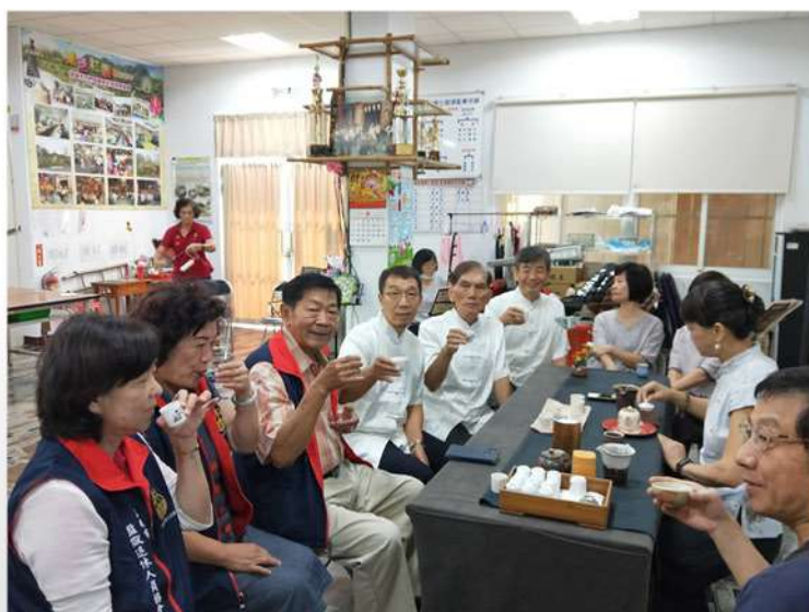
茶藝老師跟大家分享茶席佈置及茶湯品茗